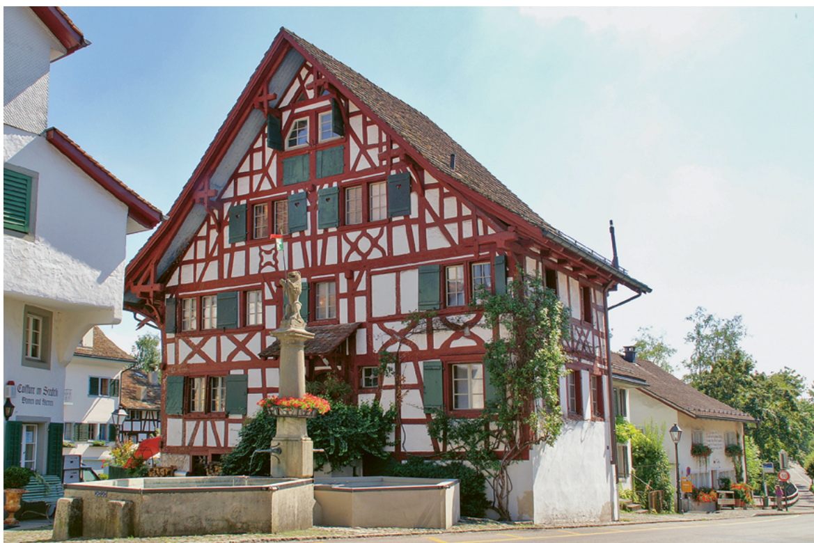
Am 16. März kann man im Stedtlibrunnen ein warmes Bad nehmen. (Archivbild)